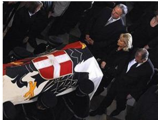
Begräbnis Altbürgermeister Zilk (2008)