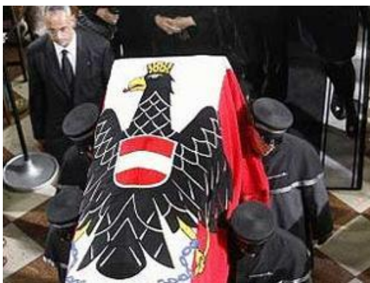
Staatsbegräbnis BP Klestil (2004)