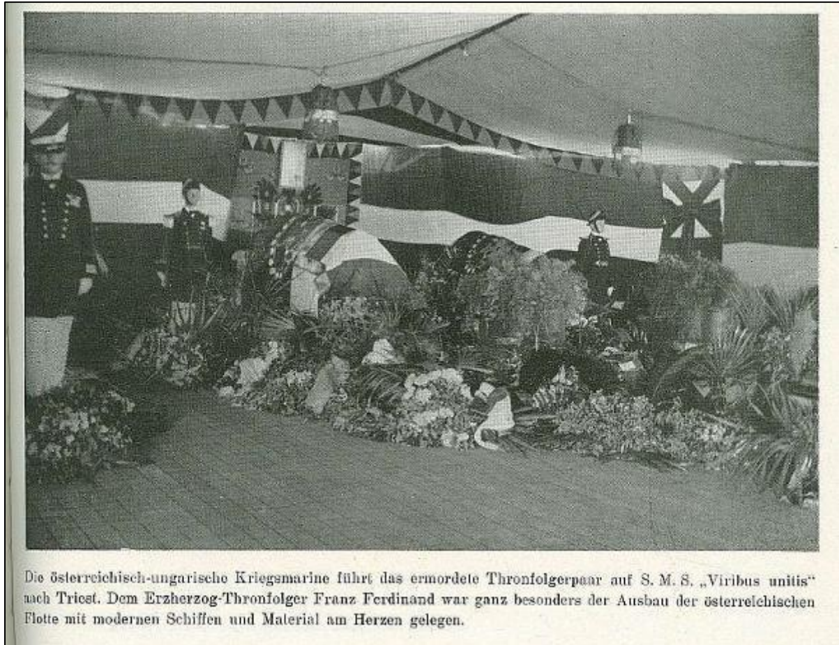
Sarg des Thronfolgers auf der "Viribus Unitis" (1914)

Bei Abspielen des Liedes "Ich hatt' einen Kameraden" und bei der Versenkung eines Sarges wird die Fahne zur Ehrenbezeugung gesenkt.