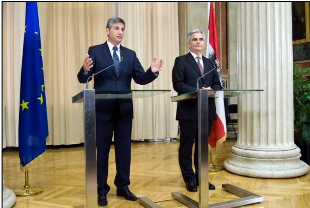
Fahmentuch korrekte Länge

Die Rangordnung der Fahne entspricht jener der Flagge. So wird etwa bei einem Vortrag oder bei einer Pressekonferenz die österreichische Fahne hinter dem Rednerpult zur Rechten des Redners aufgestellt. Ist der Vortragende ein ausländischer Gast, tritt seine Nationalfahne hinzu und steht hinter dem Rednerpult zur Linken des Redners. Die Fahne wird lotrecht aufgestellt, sodass das Fahnenblatt vor dem Stock harmonisch herunterfällt. Das Fahmentuch soll so dimensioniert sein, dass es relativ weit zum Boden reicht.