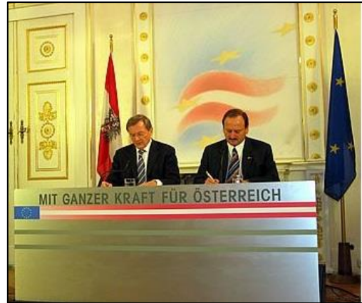
Fahmentuch zu kurz

Bei Umzügen und Aufmärschen wird die rot-weiß-rote Fahne an der Spitze des Zuges, jedoch immer nach einer eventuell teilnehmenden Musikkapelle getragen.