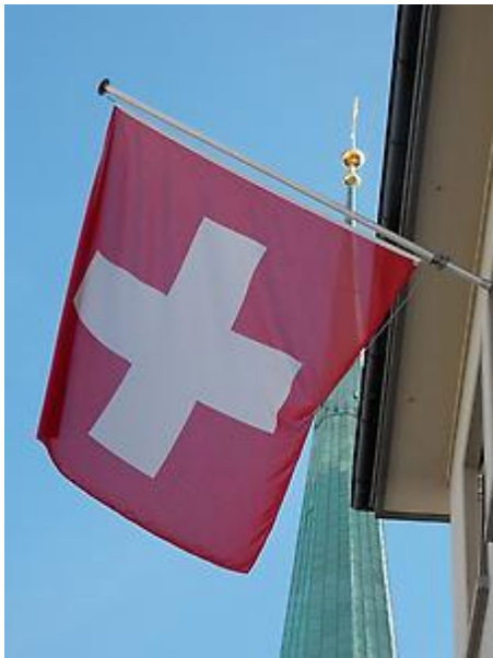
Stabilisator in der Schweiz