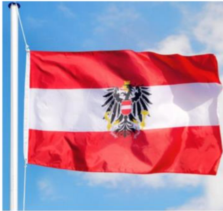
Wappenflagge an eine Leine gehisst

In den am Meer liegenden Ländern, wo ja Wind und Seewasser noch stärker wirksam werden als Schnee und Regen bei uns, werden Flaggen grundsätzlich an Leinen hochgezogen – heute sind dies praktisch unverwüstliche Kunststoffschnüre.