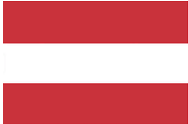
Nationalflagge für Textildruck

"Die Flagge der Republik Österreich besteht aus drei gleich breiten waagrechten Streifen, von denen der mittlere weiß, der obere und der untere rot sind." (Art.8a B-VG, BGBl.350/1981 sowie gleichlautend § 3 Abs.2 Wappengesetz, BGBl.159/1984)