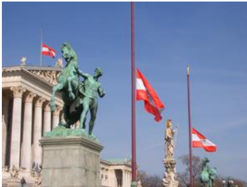
Trauerbeflaggung am Parlament

Am Morgen des Beisetzungstages wird die Flagge auf Halbmast gesetzt, bis sie nach der Beerdigung wieder auf Vollmast gehisst wird.