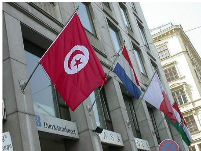
Der Stabilisator im Einsatz am Opernringhof