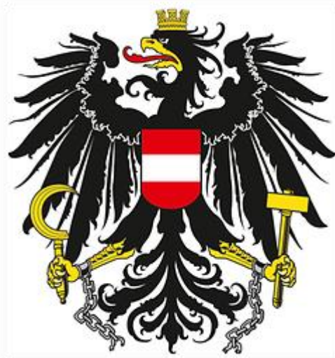
Korrektes Bundeswappen Farbe